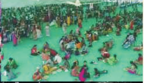
वेसर शो - सोशनी