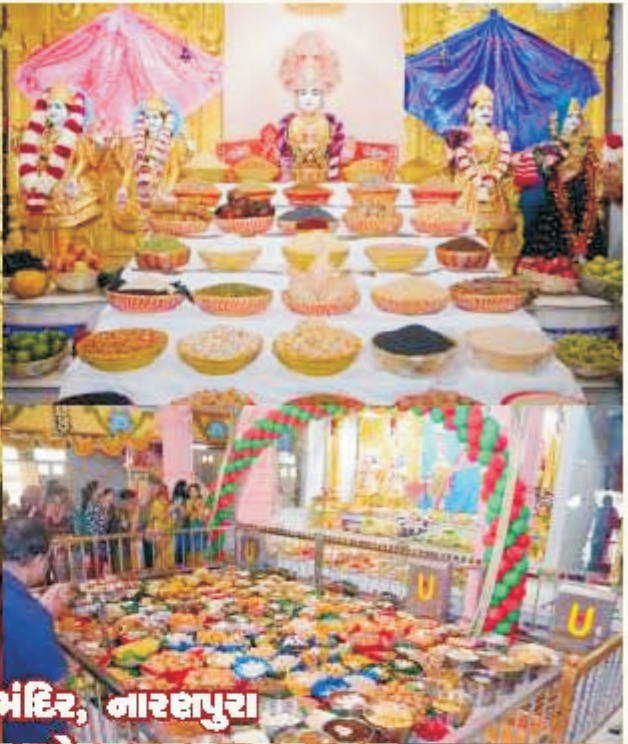
શ્રી સ્વામિનારાયણ મંદિર, નારણપુરા સ્વત્વ જયંતી મહોત્સવ