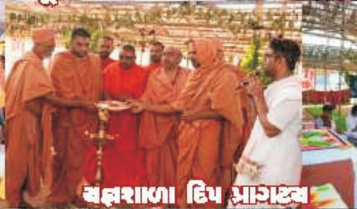
સજ્ઞાસાળા દિપ પ્રાગટ્ય