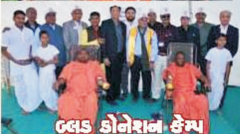
GLS डोनेशन केम्प