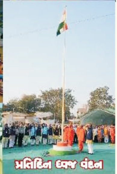
પ્રતિદિન ધ્વજ વંદન