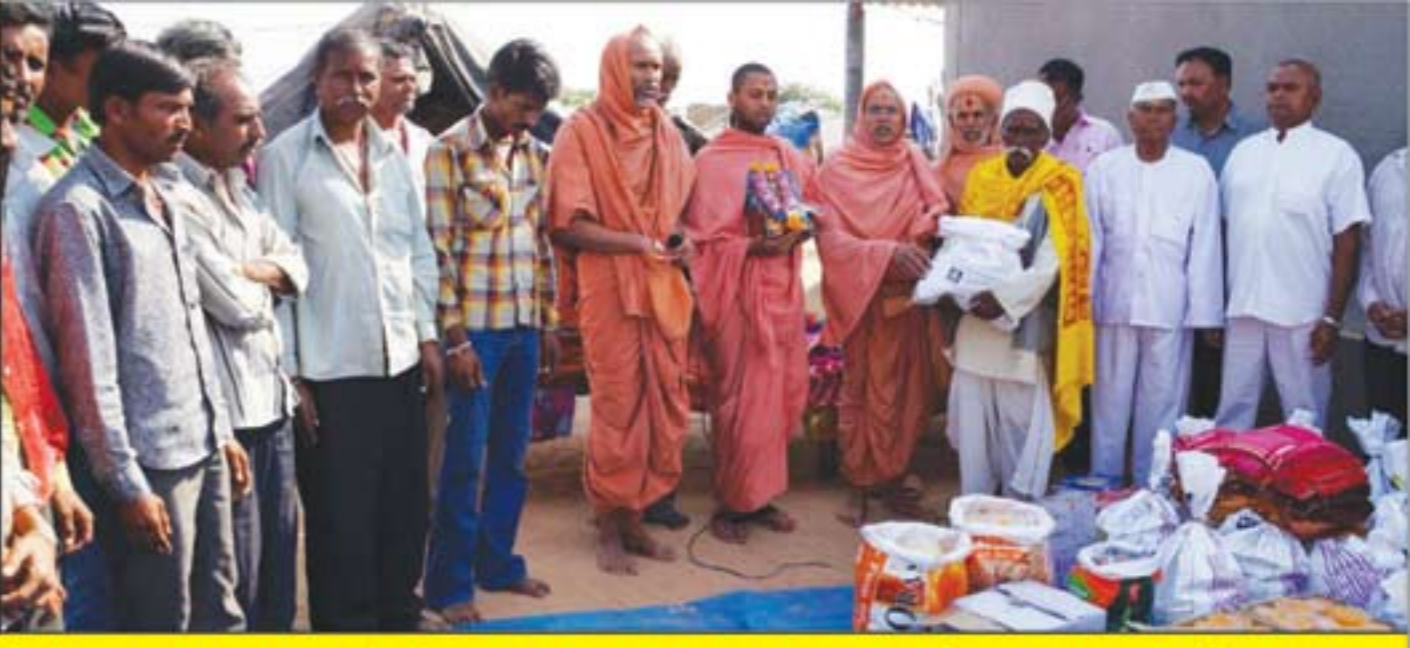
ભુજ મંદિર દ્વારા અબડાસા વિસ્તારના જરૂરિયાતમંદ પરિવારોને તથા બાળકોને ધાબળા, અનાજ સાથે પ્રસાદનું વિતરણ