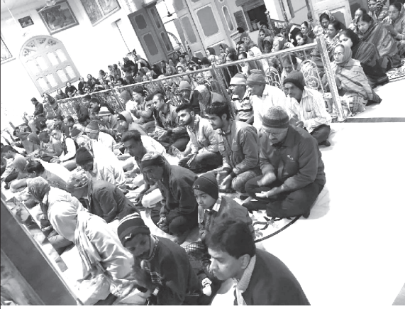
ધનુર્સભાસમાં ધૂન કરતા હરિભક્તો, પ્રસાદિ મંદિર, ભુજ