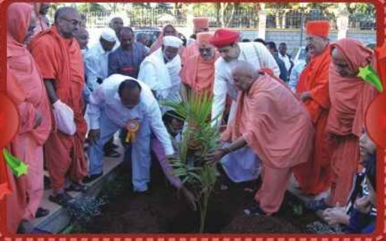
(૧-૨) વિશ્વનુયાગની પૂર્વે તૈયારી માટે દેહ શુદ્ધિ (૩) યજ્ઞશાળામાં શ્રી ઠાકોરજીનો અભિષેક કરતા સંતો (૪) ..... ..... મંદિરનું ઉદ્ઘાટન પૂ. મહારાજશ્રી અને પૂ. મહંત સ્વામી (૫) શિખરના યમાનશ્રીઓ (૬) ત્રિદીવસીય વિશ્વનુયાગની સમાપ્તીમાં શ્રીફળ હોમતા પ. પૂ. આચાર્ય મહારાજશ્રી, મહંત સ્વામી સાથે યજ્ઞમાનો (૭) મંદિરના ચોકમાં બિરાજતા શ્રી નીલકંઠવર્ણી (૮) મંદિરના ચોકમાં વૃક્ષરોપણ કરતા પ. પૂ. મહારાજશ્રી તથા સંતો.