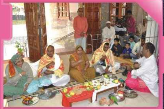
(૧) શ્રી ક.સ. સ્વામિનારાયણ મંદિર નેરોબી લેઝીમઅને બેન્ડ (૨) શિખર ઉપર ધ્વજા ફરકાવતા યજમાનો (૩) શ્રી ઠાકોરજીની આરતી કરતા પ.પૂ. આચાર્ય મહારાજશ્રી તથા પ.પૂ. મહંત સ્વામી (૪) સાંસ્કૃતિક કાર્યક્રમ રજુ કરતી શ્રી સ્વામિનારાયણ યુવતી મંડળની યુવતીઓ (૫) રાસોત્સવનો લાભ લેતા બહેનો. (૬) શ્રી પુ.આ.સ. સ્વામિનારાયણ મંદિરની બેન્ડ અને લેઝીમ (૭)..... આરતી ઉતારતા પૂ. સ્વામી (૮) યજમાનશ્રીને ઘેર મહાપૂજા.....